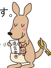
遺言書ほかんガル